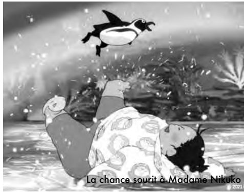
La chance sourit à Madame Nikuko