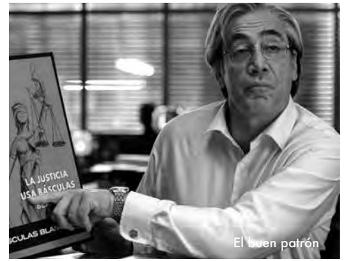
El buen patrón