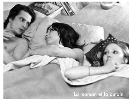
La maman et la putain

Chef-d'œuvre-fléuve sur un triangle amoureux. [...] Cette autofiction tourmentée brille toujours par sa fibre littéraire éperdue, et résonne encore comme une sublime bravade. www.troiscouleurs.fr